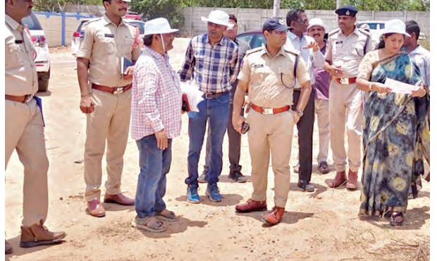
సింపల్ వర్కలను ఏర్పాటు పరిశీలిస్తున్న సంగారెడ్డి ఎస్సీ పారిటీషన్ వంకణ్

యను పూర్తి చేయాలని మంత్రి దామోదర రాజనర్సింహ అధికారులను ఆదేశించారు. అధికారులు సమన్వయంతో పనిచేసి వారం రోజుల్లో కొనుగోళ్ల ప్రక్రియను పూర్తి చేసేలా చర్యలు తీసుకోవాలని సూచించారు. శనివారం కలెక్టరేట్ మిసి సమావేశ మందిరంలో జిల్లా కలెక్టర్ ప్రతీక్ జైన్ తో కలిసి రెవెన్యూ డి.వి.జనల్ అధికారులు, సివిల్ సప్లై అధికారులతో మంత్రి ధాన్యం కొనుగోలు పురోగతి పై సమీక్షించారు. ఈ సందర్భంగా జిల్లాలో మొత్తం ఎంత మేర ధాన్యం కొనుగోలు కేంద్రాలకు వచ్చింది, ఇప్పటివరకు ఎంత ధాన్యం కొనుగోలు చేశారు, ఎంత మేర రైస్ మిల్లులకు తరలించారు, రైతుల ఖాతాల్లో కొనుగోలుచేసిన ధాన్యానికి సంబంధించిన చెల్లింపులు సకాలంలో జమ అవుతున్నాయా అనే అంశాలపై అధికారులను అడిగి తెలుసుకున్నారు. అలాగే ధాన్యం రవాణాకు అవసరమైన వాహనాల లభ్యత, రవాణా ప్రక్రియలో ఎదురవుతున్న సమస్యలపై అత్యంత ప్రాధాన్యతను సేవకల్పించి ధాన్యం తరచుచూ ప్రత్యేక జాగ్రత్తలు తీసుకోవాలని, కొనుగోలు చేసిన ధాన్యాన్ని ఎప్పటికప్పుడు మిల్లులకు తరలింపేలా చర్యలుచేపట్టాలని మంత్రి సూచించారు. రైతులు ఎలాంటి ఇబ్బందులు ఎదురవుకుండా అధికారులు అన్ని విధాల సహకారంపాలని తెలిపారు. ప్రభుత్వం రైతుల సంక్షేమానికి అత్యంత ప్రాధాన్యత ఇస్తోందని, అంతేకాక చెంచాల్లిన అవసరం లేదని వివరించిన ధాన్యం గింజ వరకు కొనుగోలు చేసే మంత్రి పేర్కొన్నారు. సమావేశంలో అడిషనల్ కలెక్టర్ సంగీత, పాడు, సబ్ కలెక్టర్ ఉమాకాళిదేవి, రెవెన్యూ డి.వి.జనల్ అధికారులు, సివిల్ సప్లై అధికారులు, సంబంధిత శాఖల అధికారులు పాల్గొన్నారు.