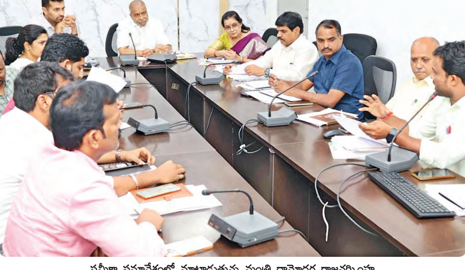
సమీక్షా సమావేశంలో మాట్లాడుతున్న మంత్రి దామోదర రాజనర్సింహ