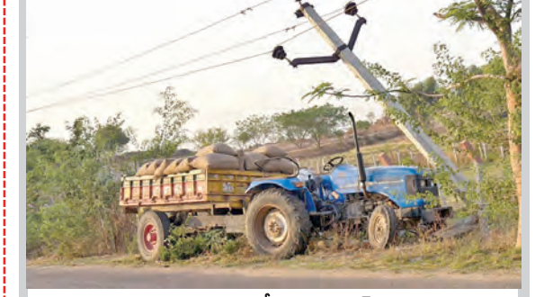
విద్యుత్తు సౌకర్యాన్ని డి.కా.వే.లో దృశ్యం