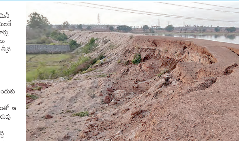
లక్షలు వెచ్చించినా కుంగిపోయిన ఎర్ర చెరువు కట్ట దృశ్యం

గుమ్మడిపేట మే 30 ప్రభాతవార్త గుమ్మడిపేట మున్సిపాలిటీ పరిధిలోని ఎర్రచెరువు మిసి ట్యాంక్ బండ్ అభివృద్ధి అంశం సందర్భంగా హామీలకే పరిమితమవుతూ వస్తోంది. అభివృద్ధి చేయలే పలుమార్లు ప్రకటనలు, హామీలు చేసినప్పటికీ ఇప్పటివరకు పనులు మాత్రం ముందుకు కదలకపోవడంతో స్థానిక ప్రజల్లో తీవ్ర ఆసంతృప్తి నెలకొంది. ప్రజల ఆవసరాలను దృష్టిలో పెట్టుకుని అభివృద్ధి పనులు చేపడతామని చెప్పిన నాయకులు, అధికారులు ఆ మాటలను ఆచరణలోకి తీసుకురావడంలో విఫలమయ్యారని గ్రామస్థులు లక్షల రూపాయల ప్రజా ధనం వెచ్చిస్తే పనులు చేపట్టినప్పటికీ సరైన ప్రణాళిక, పర్యవేక్షణ లేకపోవడంతో ఆ పనులు ఆగిపోవడం ఫలితాలను ఇవ్వలేకపోయాయని చెరువు కట్ట ఒకప్పుడు కృంగి మట్టి కొట్టుకుపోయిన అలాగే పడలేనారని స్థానిక రైతులు వాపోతున్నారు. అభివృద్ధి చేయలే ఖర్చు చేసిన నిధులు వృథా అయ్యాయని ప్రజలు ఆగ్రహం వ్యక్తం చేస్తున్నారు. ప్రతి ఎన్నికల సమయంలోనూ, సమావేశాల సందర్భంలోనూ ఎర్రచెరువు మిసి ట్యాంక్ బండ్ ను ఆధునికంగా తీర్చిదిద్దతామని, ప్రజలకు విశ్రాంతి తీసుకునే విహార స్థలంగా మార్చుతామని నాయకులు గొప్పలు చెప్పుకుంటున్నప్పటికీ, ఆ హామీలు కాగితాకే పరిమితమయ్యాయని ప్రజలు విమర్శిస్తున్నారు. ఎక్కడ వేసినా